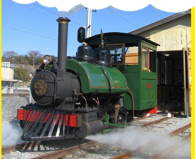
2007年3月北勢線開業90周年記念運転